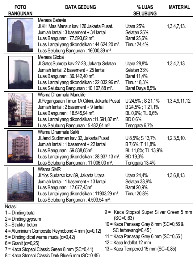
Tabel 1. Data-Data Bangunan yang Diteliti